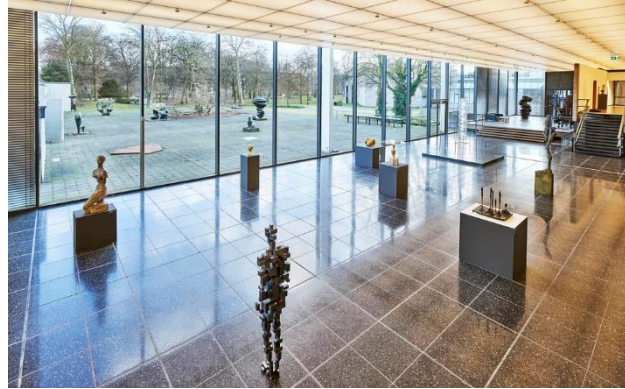
Lehmbruck Museum, Blick in die Glashalle, Dejan